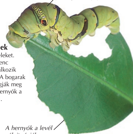
A hernyók a levél széleit rágják meg.