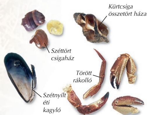
Kürtcsiga összetört háza

Az édesvízi folyók és tavak partján vagy félreeső tengerparti szakaszokon halfejet, -farkat vagy egyéb megrágott haldarabokat találhatsz. Ez a vidrák jelenlétére utalhat.