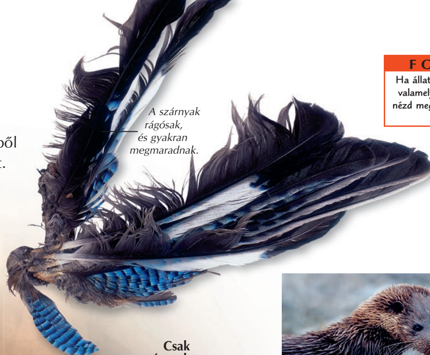
A szárnyak rágósak, és gyakran megmaradnak.

Egyes állatok nem hagynak maguk után tápláléknyomokat. Mások sokkal rendtelenebbek, és a hátrahagyott jelekből kitalálhatod az állat fajtáját és táplálékát. Felfedezőutadon alaposan nézz körül, és hamarosan sok ilyen nyomot találsz, amelyek alapján összeírhatod, mely állatok élnek a környéken. Például ha elhullott állatra bukksz, akkor egy gyors pillantással megállapíthatod, hogy milyen állat ölte meg. Ha megrágott leveleket vagy terméseket találsz, talán azt is meg tudod mondani, milyen állat rágta meg őket.